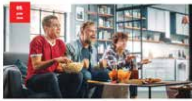
PROFESSIONAL Headed by the meeting Fußball erleben wie nie zuvor Es ist eine tolle Zeit für Fans: Die neue Stadion-Struktur für die Fußball-Liga ist endlich fertig. Die Fans können nun nicht nur die Spiele der Fußball-Liga erleben, sondern auch die Atmosphäre der Fans. Die Fans können nun nicht nur die Spiele der Fußball-Liga erleben, sondern auch die Atmosphäre der Fans.

Weitere Themen werden nach Bedarf und Aktualität aufgenommen. Wir informieren Sie laufend mittels eMail-Reminder über die kommenden Schwerpunkte auf www.akustiker.at