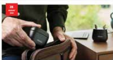
PROFESSIONAL Headed by the hearing Oticon SmartCharger miniRITE Das Oticon SmartCharger miniRITE ist ein innovatives Ladegerät für Ihre Oticon Hörgeräte. Es ermöglicht Ihnen, Ihre Hörgeräte zu laden und gleichzeitig Ihre Hörgeräte mit Ihrer Smartphone-App zu steuern. Das Oticon SmartCharger miniRITE ist ein innovatives Ladegerät für Ihre Oticon Hörgeräte. Es ermöglicht Ihnen, Ihre Hörgeräte zu laden und gleichzeitig Ihre Hörgeräte mit Ihrer Smartphone-App zu steuern.

Obiges Beispiel erschienen am 3. Juli 2024