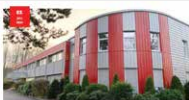
PROFESSIONAL Headed by the hearing Dreive feiert 75. Firmenjubiläum Nach mehr als sieben Jahrzehnten Erfahrung und über 75 Jahren ist Dreive ein etablierter Name im Hörakustik-Bereich. Neben der Produktion von Hörsystemen ist Dreive auch ein führender Hersteller von Gehörhilfen. Die Dreive Group ist ein führender Hersteller von Gehörhilfen. Die Dreive Group ist ein führender Hersteller von Gehörhilfen. Die Dreive Group ist ein führender Hersteller von Gehörhilfen.

Obiges Beispiel erschienen am 5. Juni 2024