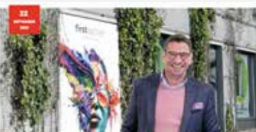
FirstAkustiker und FirstOptiker punkten mit Top-Einkaufskonditionen und Transparenz

Obiges Beispiel erschienen am 19. September 2023