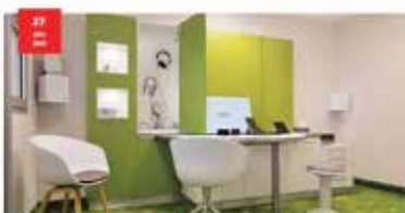
side by side: Immer am Ohr des Kunden! Immer mehr Unternehmen setzen auf die Digitalisierung. Dies ist ein großer Schritt in die Zukunft. Die Digitalisierung ermöglicht es Unternehmen, ihre Kunden besser zu verstehen und ihnen bessere Services anzubieten. Die Digitalisierung ist ein Schlüsselfaktor für den Erfolg eines Unternehmens. Die Digitalisierung ermöglicht es Unternehmen, ihre Kunden besser zu verstehen und ihnen bessere Services anzubieten. Die Digitalisierung ist ein Schlüsselfaktor für den Erfolg eines Unternehmens.

Obiges Beispiel erschienen am 25. Mai 2023