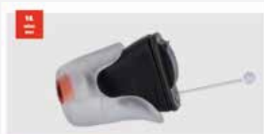
Produktinformationen im akustiker.at Professional-Bereich

Obiges Beispiel erschienen am 23. Februar 2023