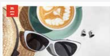
Produktinformationen im akustiker.at Professional-Bereich

Obiges Beispiel erschienen am 16. März 2023