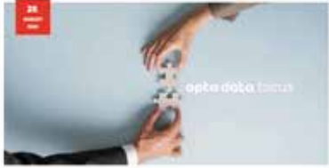
opta data focus - die starke neue Kompetenzmarke für Hörakustikerinnen und Optikerinnen

Weitere Themen werden nach Bedarf und Aktualität aufgenommen. Wir informieren Sie laufend mittels eMail-Reminder über die kommenden Schwerpunkte auf www.akustiker.at