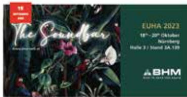
Hörgeräte „Made in Austria“ : BHM-Tech präsentiert sich auf der EUHA 2023

Obiges Beispiel erschienen am 20. August 2023