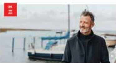
Knochenleitungshörsysteme vom Spezialisten Mittels Knochenleitungshörsysteme können Hörverluste behandelt werden. Diese Systeme sind eine Alternative zu herkömmlichen Hörgeräten. Sie sind besonders geeignet für Menschen mit Mittelohr- oder Innenohrproblemen. Die Knochenleitungshörsysteme übertragen die Schwingungen des Schalls direkt auf das Innenohr. Dies ermöglicht eine bessere Hörfähigkeit und eine höhere Sprachverständlichkeit. Die Knochenleitungshörsysteme sind eine innovative Lösung für Menschen mit Hörverlusten.

Obiges Beispiel erschienen am 23. Mai 2023