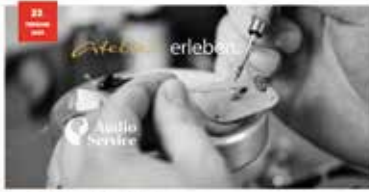
Produktinformationen im akustiker.at Professional-Bereich

Medienexperte für Hörakustik in Österreich