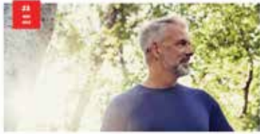
Klein und so leistungstark wie noch nie Der Content-Marketing-Kolossale ist kein Zufall. Er ist das Ergebnis einer langjährigen Zusammenarbeit mit dem Akustiker-Team. Die Inhalte sind nicht nur leistungstark, sondern auch zielgerichtet. Sie sind so konzipiert, dass sie die Aufmerksamkeit der Leser auf sich ziehen und sie dazu verleiten, mehr zu erfahren.

Produktinformationen im akustiker.at Professional-Bereich